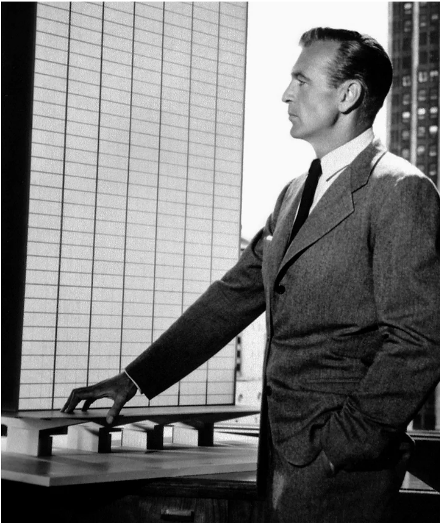
King Vidor, 'The Fountainhead', 1949.