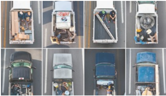
XII BIENAL FEMSA