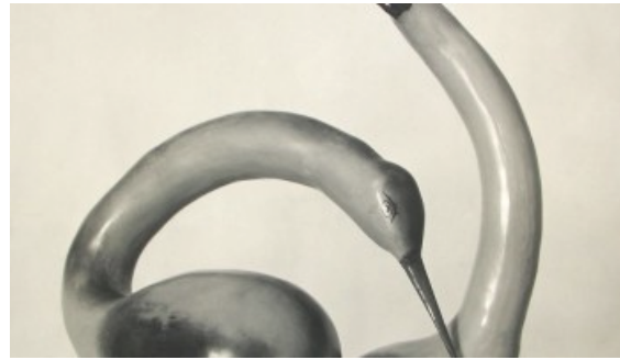
AL DESCUBIERTO: LA HOWARD GREENBERG GALLERY EN MADRID