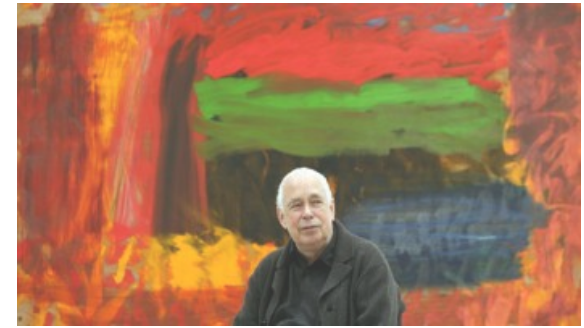
MUERE HOWARD HODGKIN