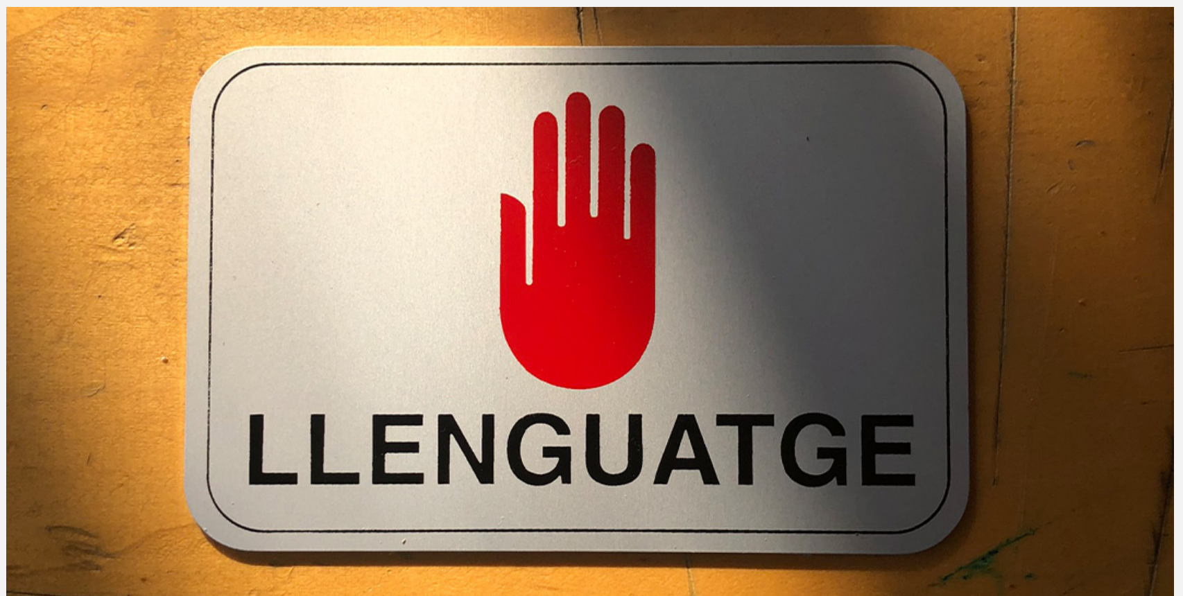
Crecimiento y decrecimiento de Howard Roark , en Chiquita Room y The Green Parrot

La exposición, inspirada en el personaje de ficción de Howard Roark, protagonista del film The Fountainhead de King Vidor (1949), un arquitecto ambicioso que quiere dejar su huella en el mundo a pesar de las reticencias del entorno, explora los efectos del capitalismo a través de una reflexión artística y poética sobre la arquitectura, los límites de la vida humana y el lenguaje.